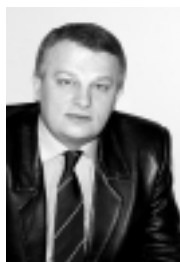
Stepan Kubiv Chairman